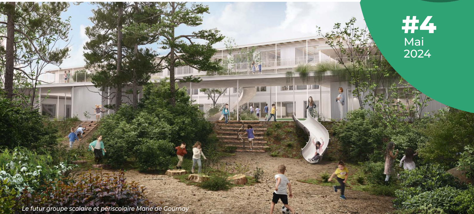
Le futur groupe scolaire et périscolaire Marie de Gournay