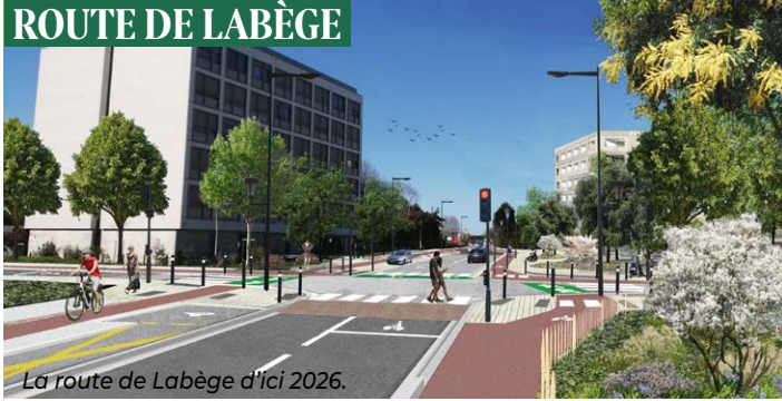
La route de Labège d'ici 2026.

Sur la route de Labège, à l'enfouissement des réseaux (électriques, de communication, eaux pluviales et eaux usées) succéderont des aménagements de surface pour améliorer et renforcer la sécurité des voies piétonnes et cyclistes, créer quelques places de stationnement et végétaliser les abords.