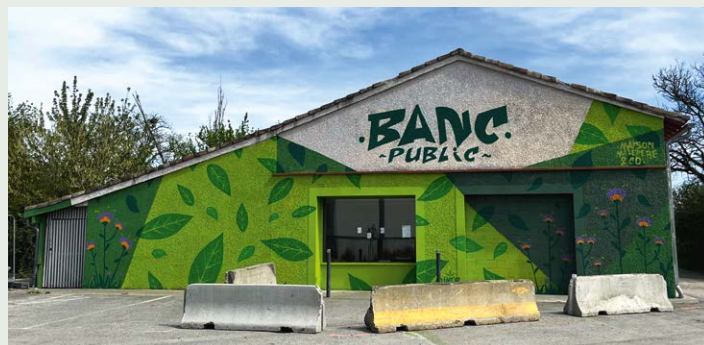
La fresque réalisée sur la façade de Banc Public, tiers-lieu qui jouxte la Maison Malepère.

« Banc Public », c'est le nom de l'espace qui s'est installé dans l'ancienne boulangerie La Panetière au 116 Route de Labège, de manière temporaire, avant la construction de logements. Ce projet d'urbanisme transitoire mené par l'association Ressources Solidaires et l'agence Intercalaire, en partenariat avec la Maison Malepère, est un lieu ouvert aux projets associatifs et collectifs, un espace d'échanges, de rencontres et de réunions au cœur du Faubourg Malepère. Son succès repose en grande partie sur les contributions des trois réunions de concertation, véritables séances de remue-méninges, menées avec les habitants pendant l'été et avec le soutien d'Oppidea.