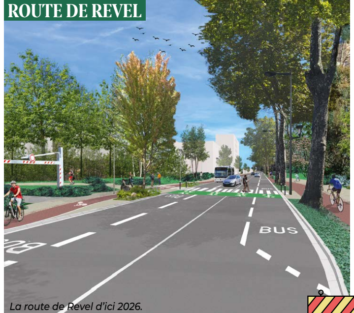
La route de Revel d'ici 2026.

Sur la route de Revel, ces transformations permettront de connecter le faubourg au Réseau Express Vélo de la métropole toulousaine et de créer un couloir de bus dédié à la circulation du Linéo 9.