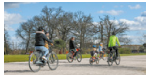
Un environnement généreux en espaces verts, pistes cyclables et cheminements piétons