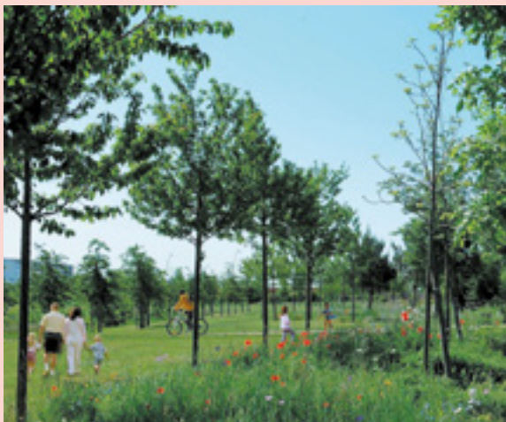
Des logements avec de larges terrasses donnant sur les cours de verdure.