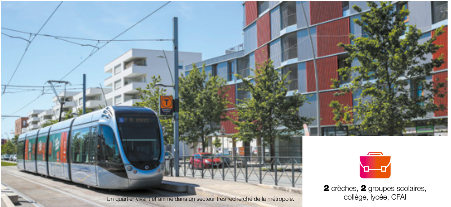
Un quartier vivant et animé dans un secteur très recherché de la métropole.