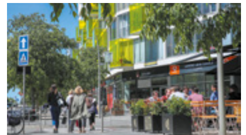
L'avenue Andromède compte de nombreux commerces