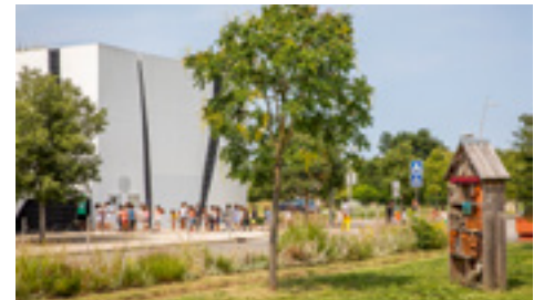
Un quartier pensé pour les familles

• Participez à la concertation avec les habitants et usagers, pour co-construire un quartier agréable (balades urbaines, ateliers participatifs, concertation sur les futurs espaces publics de la dernière phase).