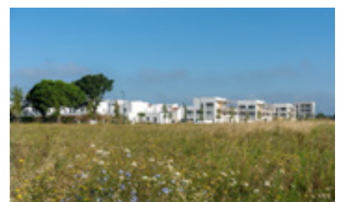
La prairie fleurie fait le lien entre Laubis et la Garonne