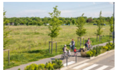
De nombreuses pistes cyclables et cheminements piétons créés

• Découvrez les bonnes pratiques respectueuses de l'environnement, rejoignez les jardins potagers partagés.