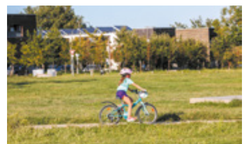
Des circulations apaisées grâce à des cheminements piétons et cycles tout autour du parc.