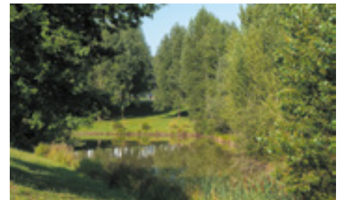
Le parc favorise la biodiversité locale en préservant le paysage et en proposant des essences adaptées au climat.

• Savourez l'offre culturelle de l'Aria, composé d'un auditorium, d'une médiathèque et d'une salle de spectacles.