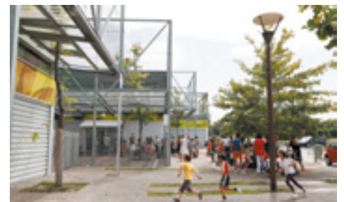
Le pôle enfance : crèche, école maternelle et élémentaire, ALAE et gymnase.