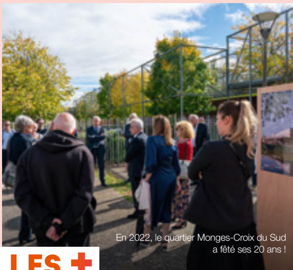
En 2022, le quartier Monges-Croix du Sud a fêté ses 20 ans !