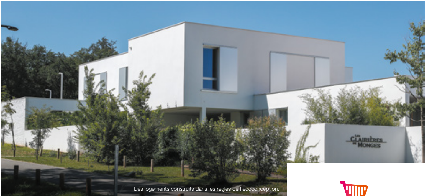
Des logements construits dans les règles de l'écoconception.