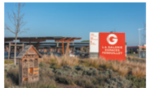
Galerie commerciale à 5 minutes : hypermarché, 110 enseignes et restaurants, cinéma multiplexe de 8 salles

• Rejoignez le centre-ville de Fenouillet , à moins de 15 minutes à pied, disposant d'une offre complète de commerces et services pour satisfaire les besoins du quotidien.