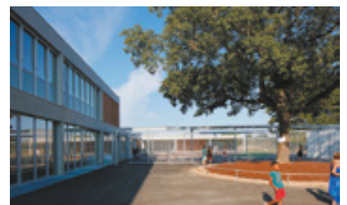
Le groupe scolaire au cœur du quartier