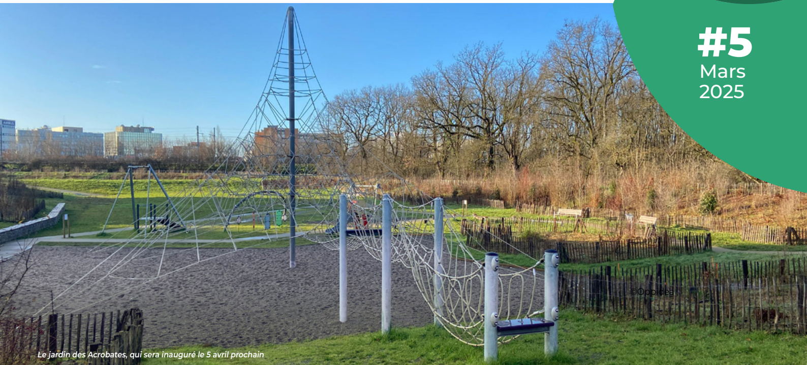
Le jardin des Acrobates, qui sera inauguré le 5 avril prochain